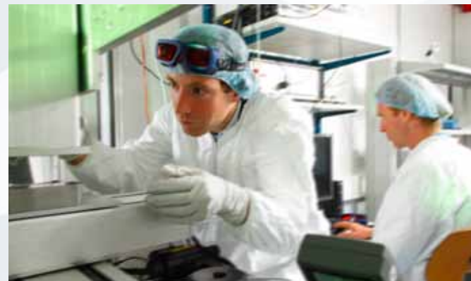
Masterplan Gebiedsontwikkeling Kennispark Twente